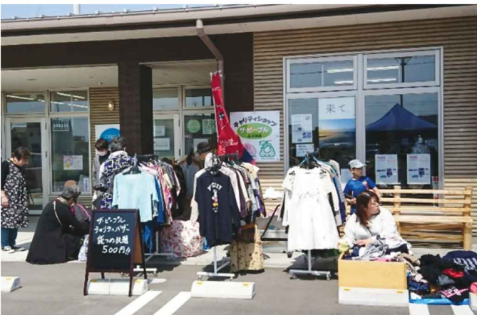
▲チャリティーバザーの様子

4月20日、いわき市久ノ浜の津波被災エリアにコミュニティ商業施設「浜風きらら」が生まれて一周年になるのを記念して、21・22日の両日、イベントが催されました。入居テナントであるザ・ピープルでは、「浜風マルシェ」と名付けられたコーナーで、チャリティーバザーを実施。通常の販売とは違い、レジ袋に古着を詰め放題500円！という形でのバザーを行いました。お隣にブースを出していた久ノ浜地区婦人会の皆さんをはじめたくさんの方が買い求めてくださって、大盛況でした。