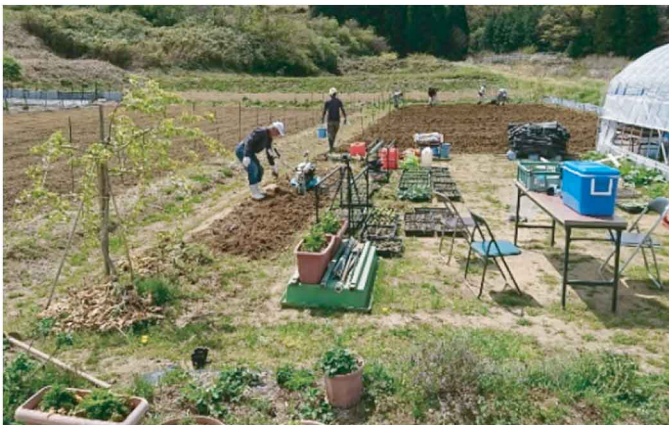
▲ここが新たな交流の拠点に

その場所をもっと魅力あるものに、そしてもっと多方面での活用が可能なものにしようと、このほど住友商事株式会社から「東日本再生フォローアップ・プログラム2017」の助成を頂き、都市農村交流拠点整備が2年がかりで進められることになりました。建物自体は今年7月までには完成の予定です。これからどんな風に拠点が生かされるのか、是非お楽しみに！