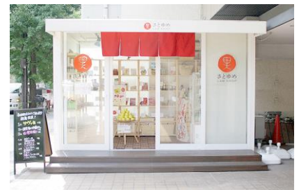
さとゆめ LAB SHOP 外観